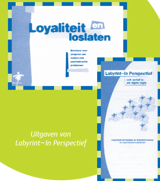
Uitgaven van Labyrint~In Perspectief

'Als ik iemand in een telefoongesprek verder geholpen heb, geeft dat een heel bijzonder en tevreden gevoel'